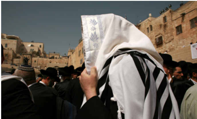
Devant le mur occidental de Jérusalem, le jour de la bénédiction des Cohanim.

Dans le judaïsme, il y a la bénédiction des Cohanim (tous ceux qui portent le nom de Cohen , qui signifie prêtre). Elle a été instaurée sous sa forme actuelle après 1967, lorsque les Juifs eurent à nouveau accès au Mur occidental. Prononcée deux fois par année, à Pesah et Succot, cette bénédiction est celle d'Aaron.