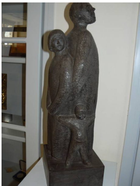
L'enfer dans la famille. Sculpture sur le thème du récit de Macaire

L'œcuménisme commence quand je renonce à juger l'autre Eglise et que je dis au membre d'une autre Eglise : « Nous appartenons à la même famille, nous nous appartenons l'un à l'autre ». « Le monde a besoin de nous entendre dire : « J'ai vraiment besoin de toi ». L'Eglise est la famille, où l'Esprit saint habite.