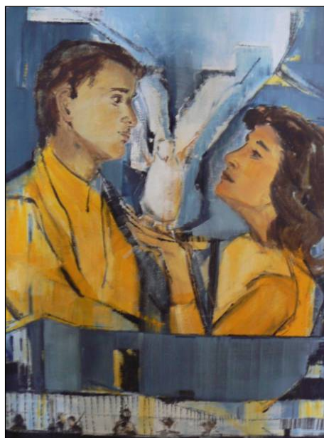
Se rencontrer face à face, en donnant place à l'Esprit saint.

Pour pouvoir se rencontrer dans la paix et la vérité, chaque communauté a besoin de faire habiter l'Esprit saint au milieu d'elle. Le faire habiter par la prière et la vie, par l'attention permanente à la volonté de Dieu. « Un regard lumineux donne une joie profonde » (Pr. 15,30), « Qui a le regard bienveillant sera béni » (Pr. 22,9). Mais un regard de jugement détruit la communauté et nous isole les uns des autres.