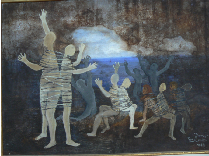
L'enfer, c'est se tourner le dos. Tableau illustrant le texte de Macaire

Au début de cette retraite, je vous propose cette prière :