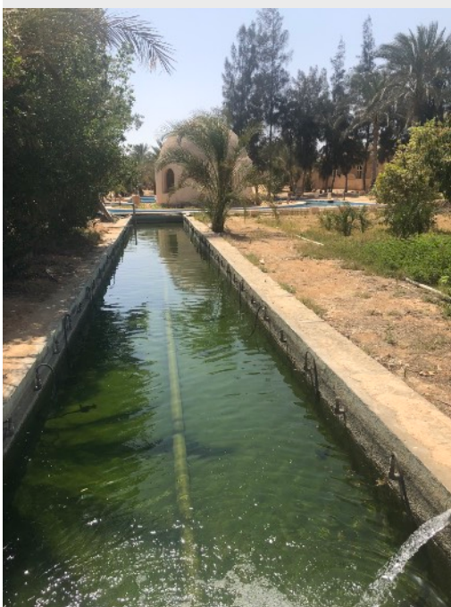
Dans le monastère d'Anafora

Elle aura lieu au magnifique monastère d'Anafora, dans le désert, entre le Caire et Alexandrie. Elle sera en partie retransmise par vidéo-conférence. La date sera définie, en fonction de la situation sanitaire de ce pays. Pour vous informer et si vous désirez y participer, merci de consulter notre site internet.