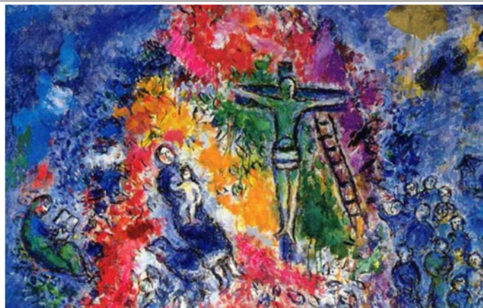
Image : L'arbre de Jessé selon Marc Chagall, extrait.

« Je suis au-dessus de vous pour vous bénir, avec vous pour vous conduire, au milieu de vous pour vous encourager et en vous pour vous renouveler ».